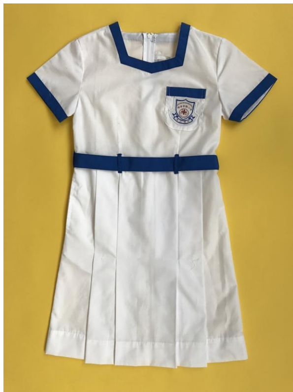
女生白色長裙配藍色領邊，胸袋邊、 袖邊及腰帶（連校徽）