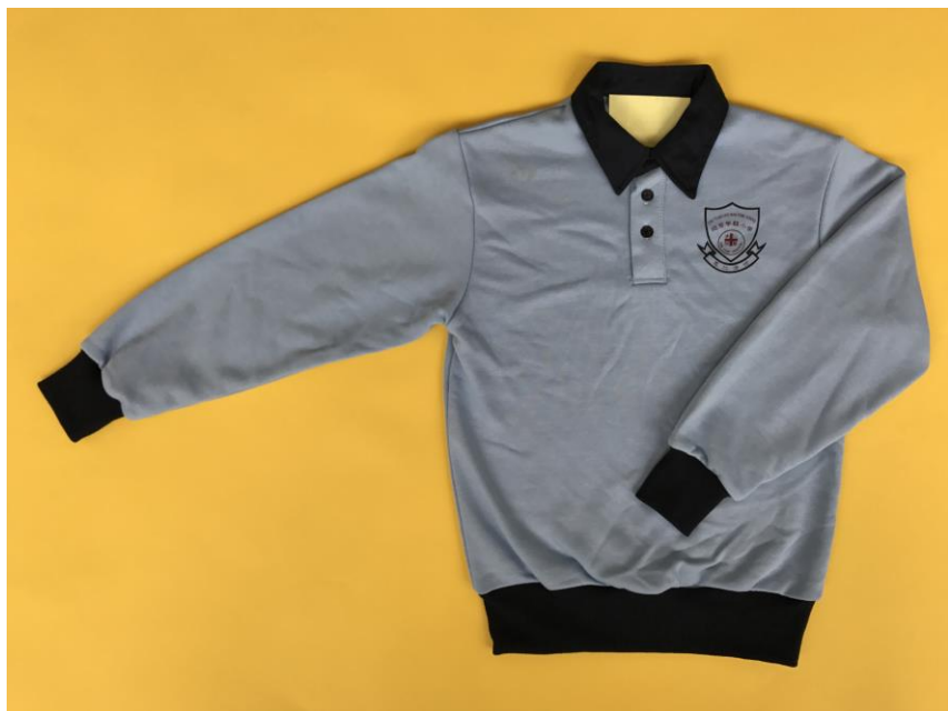
男女生長袖運動衫（印上校徽）