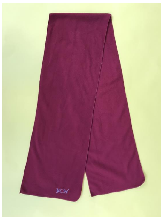
男女生冬季領巾（連學校簡稱）