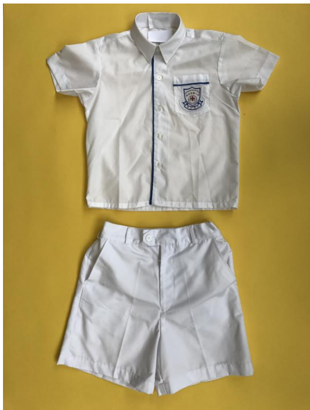
男生白色短袖恤衫配藍色邊（連校徽） 白色短西褲