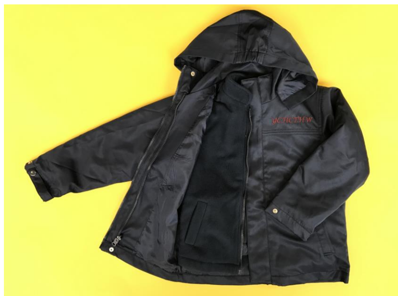
男女生二合一校褸（連學校簡稱）