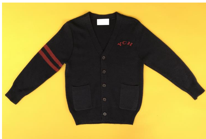
男女生開胸長袖毛衣 （連繡章仁濟醫院代號）