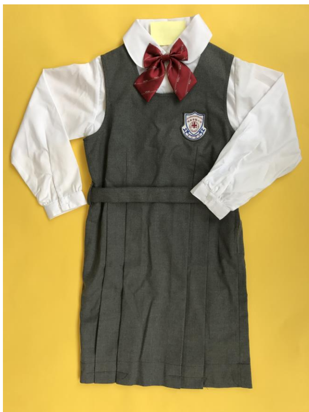
線絨半裡背心裙（連校徽） 白色長袖恤衫 蝴蝶帶