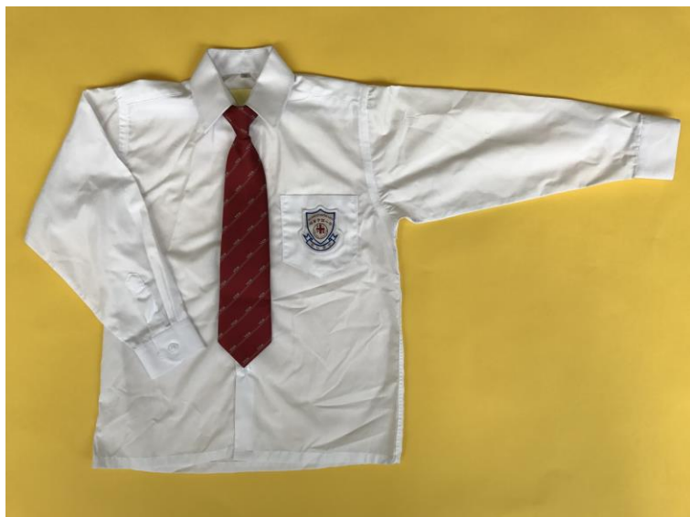
男生白色長袖恤衫（連校徽） 校夾（夾夾款，紅色，配斜間YCH字樣）