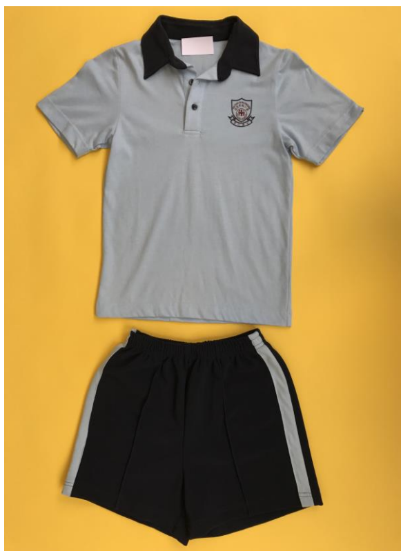
男女生短袖運動衫（印上校徽） 短運動褲