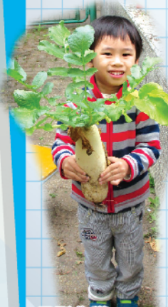
又到收穫大蘿蔔的日子了

本年度趙校繼續舉辦「社區田園」活動，在社區推廣綠色生活。除在校園種植蔬果外，為拓闊對農耕生活的認識，更組織到農場的參觀活動；在羊年將臨的時候，舉辦水仙花種植班，點綴春節家庭團聚祥和的氣氛，使綠色生活深植社區。