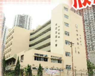
本校外牆粉飾一新迎校慶