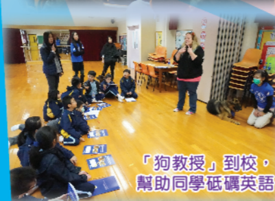
「狗教授」到校，幫助同學砥礪英語