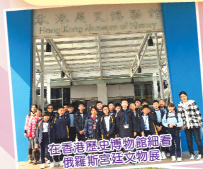
在香港歷史博物館細看俄羅斯宮廷文物展