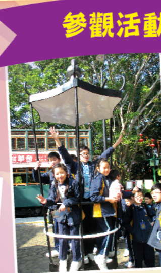
同學們在海洋公園「懷舊一條街」追憶往日交通警察生涯