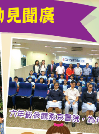
六年級參觀燕京書院，為升學準備