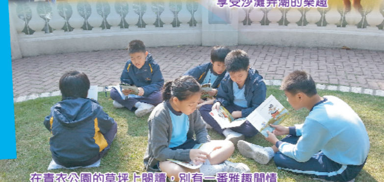
在青衣公園的草坪上閱讀，別有一番雅趣閒情