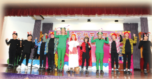
英語話劇組學生在校慶典禮日的演出