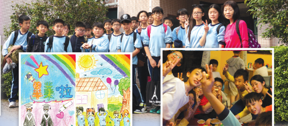
六年級年輕的我在教育營中快樂的日子