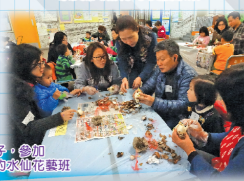
過年的日子，參加「社區田園」的水仙花藝班