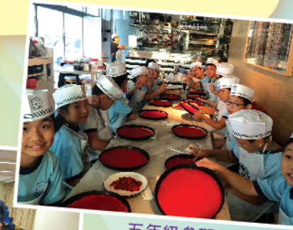
五年級參觀薄餅屋，實行一人一薄餅