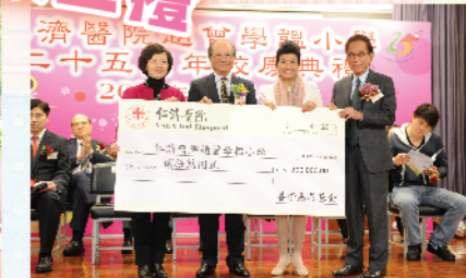
善學慈善基金慷慨捐本校二十萬元

三月三日(星期二)是趙校舉行創校銀禧慶典的日子，敦請教育局局長吳克儉太平紳士蒞臨主禮，各與友好致送賀辭、花籃……使典禮更添榮光。典禮後，一眾嘉賓享用茶點敘舊，言笑晏晏，和樂融融。