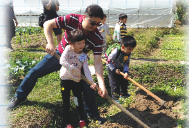
參觀粉嶺喜樂農場，家長帶領孩子享受農家樂