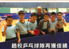
趙校乒乓球隊再獲佳績