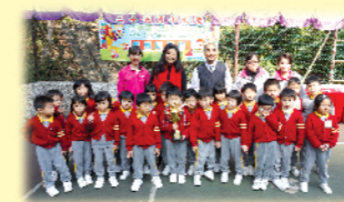
基督教香港信義會靈工幼稚園的健兒們共享努力的成果