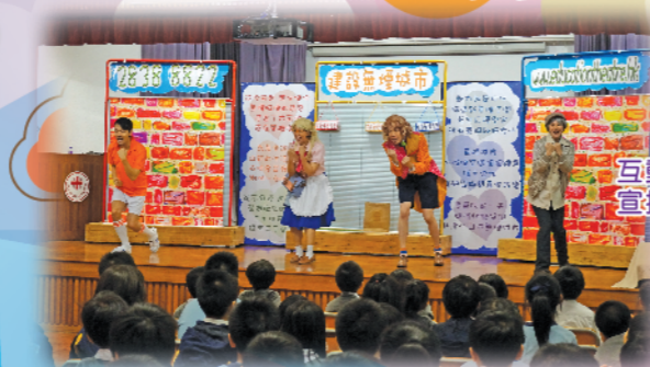
互動劇場到校演出，宣揚無煙城市