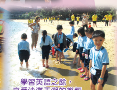
學習英語之餘，享受沙灘弄潮的樂趣