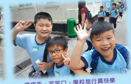
揮揮手，笑笑口，學校旅行真快樂