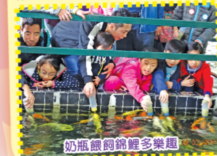
奶瓶餵飼錦鯉多樂趣