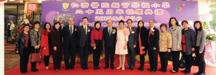
教育局長吳克儉太平紳士蒞臨主禮