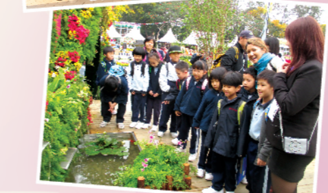
一年級在花卉展覽的場地裏細看繁花競艷