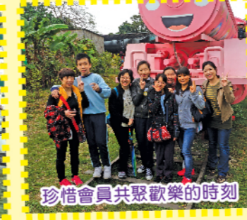
珍惜會員共聚歡樂的時刻