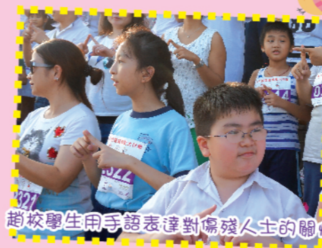
趙校學生用手語表達對傷殘人士的關懷